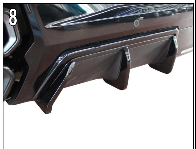
Fig. 6 until 8

Position AC Schnitzer Fins according to fitting position on the serial elevations of the rear diffuser.