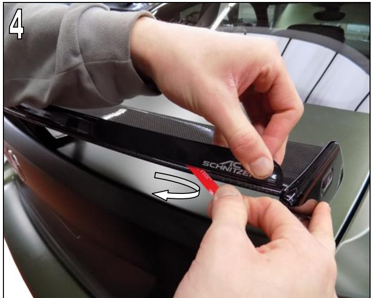
Fig. 4 & 5

Align the AC Schnitzer Gurney Flap to the rear edge of the AC Schnitzer Rear Wing Carbon and glue it step by step.