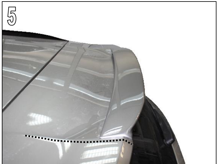
Fig. 5 & 6

The contour of the AC Schnitzer rear roof wing must run parallel to the contour of the tailgate on the right and left.